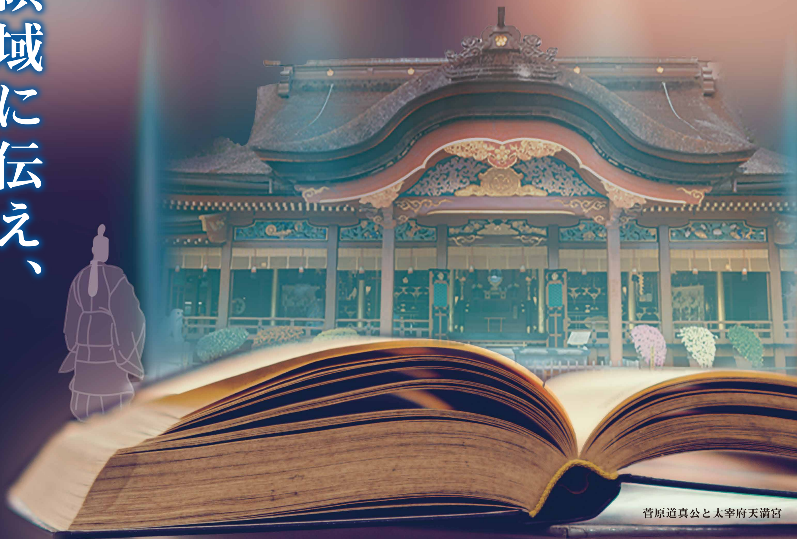
菅原道真公と太宰府天満宮